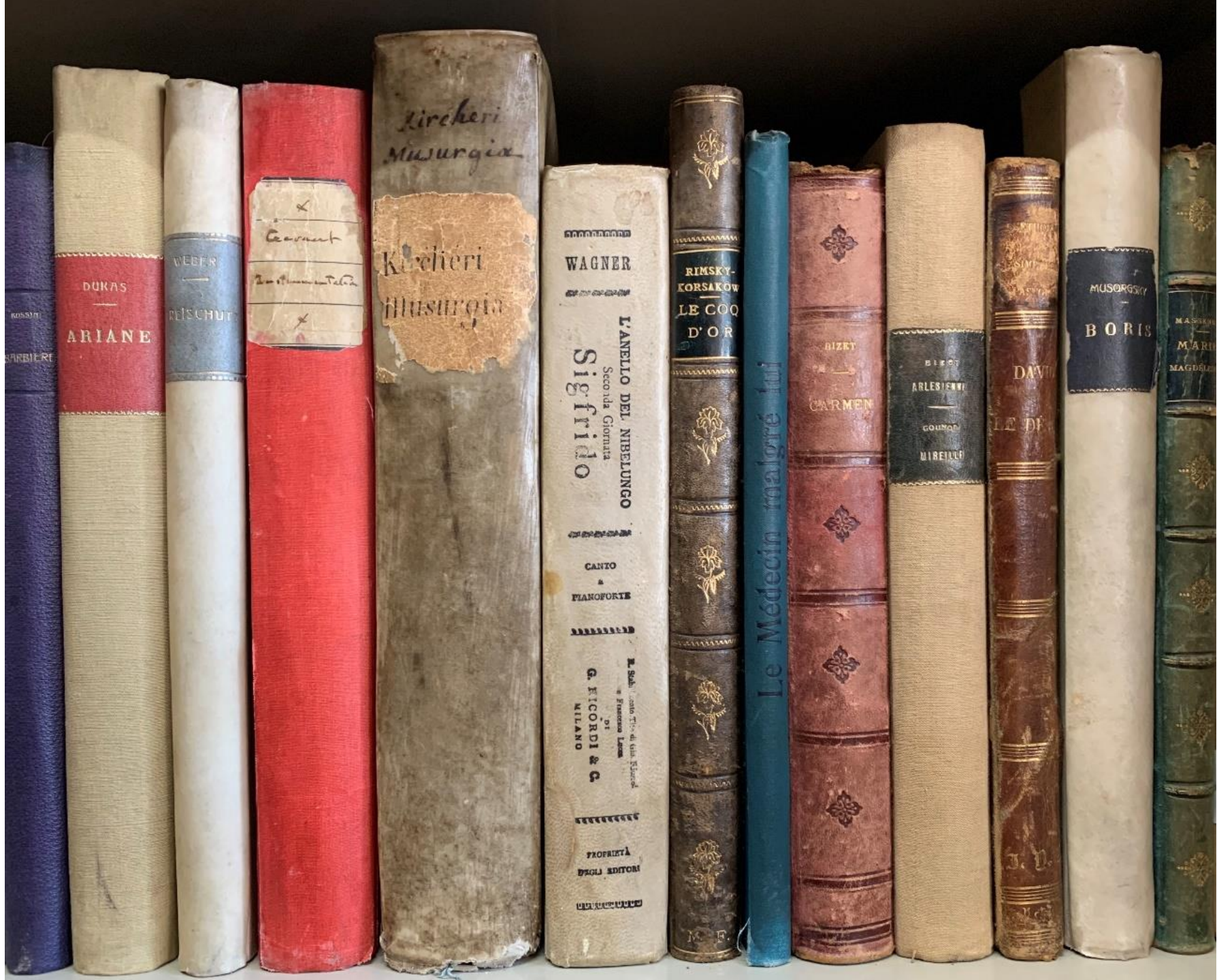
Some books and scores in his personal library.