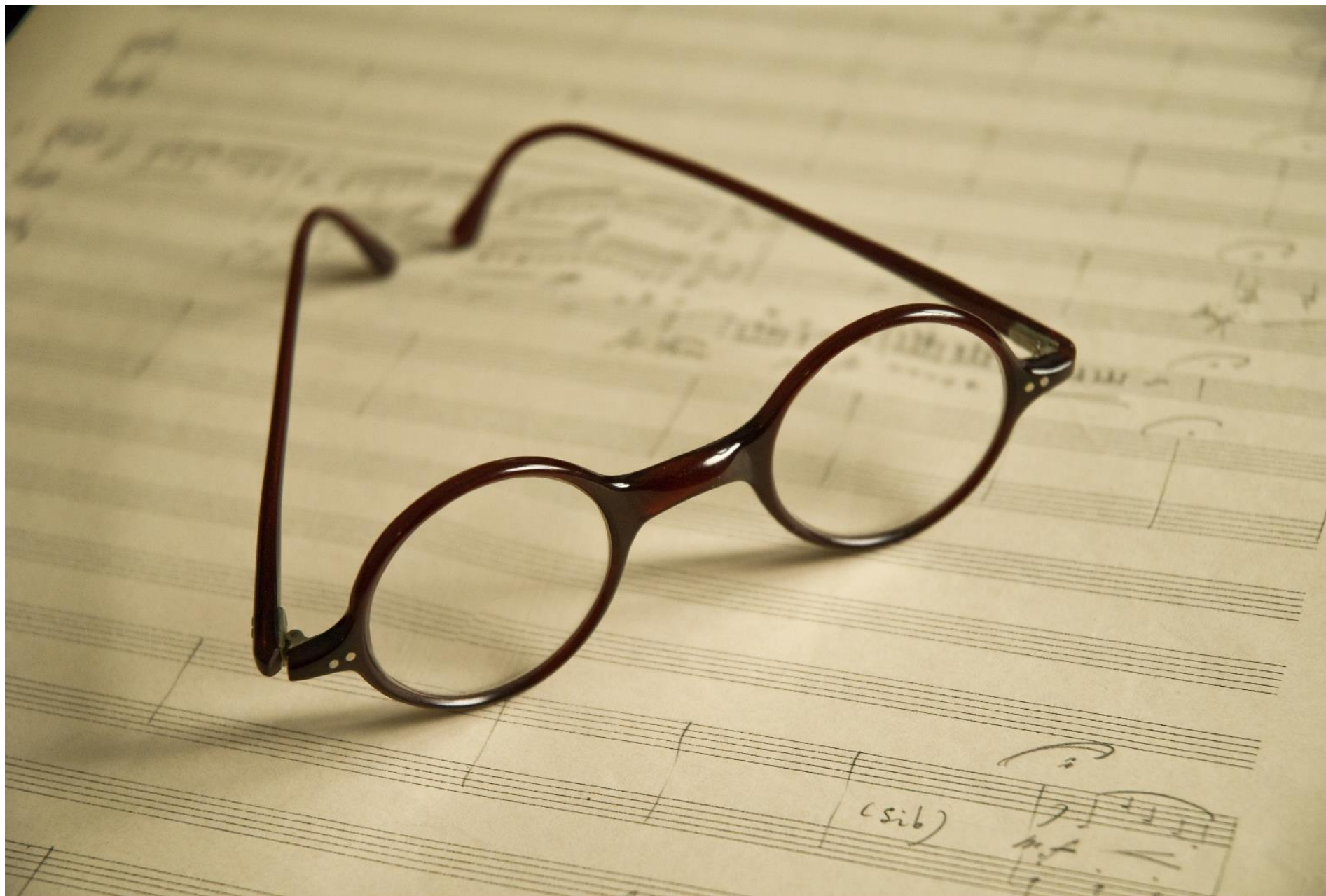
His glasses over a musical manuscript.