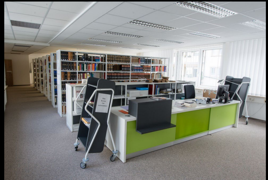
Library in the Institute's new premises in Freiburg's Rosastraße (www.zpkm.uni- freiburg.de/bib-en)