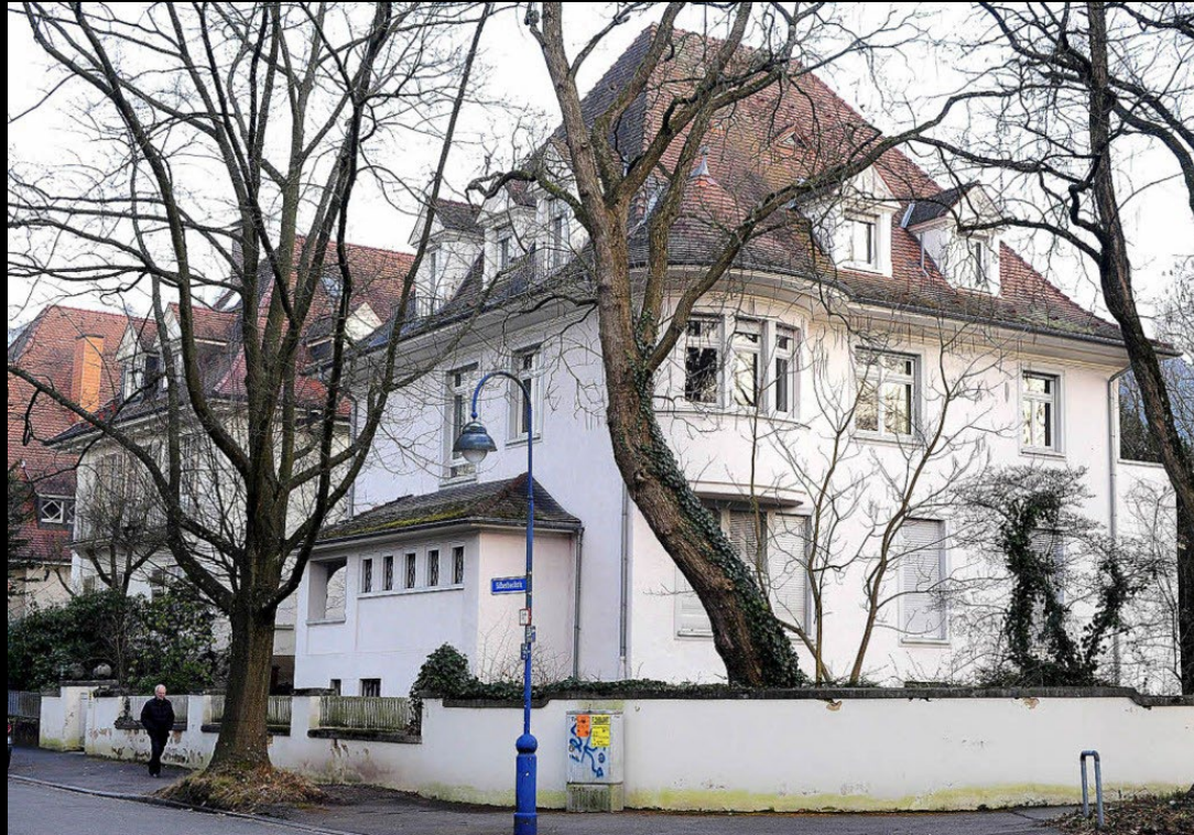
Former location of the Deutsches Volksliedarchiv in Freiburg's Silberbachstraße.