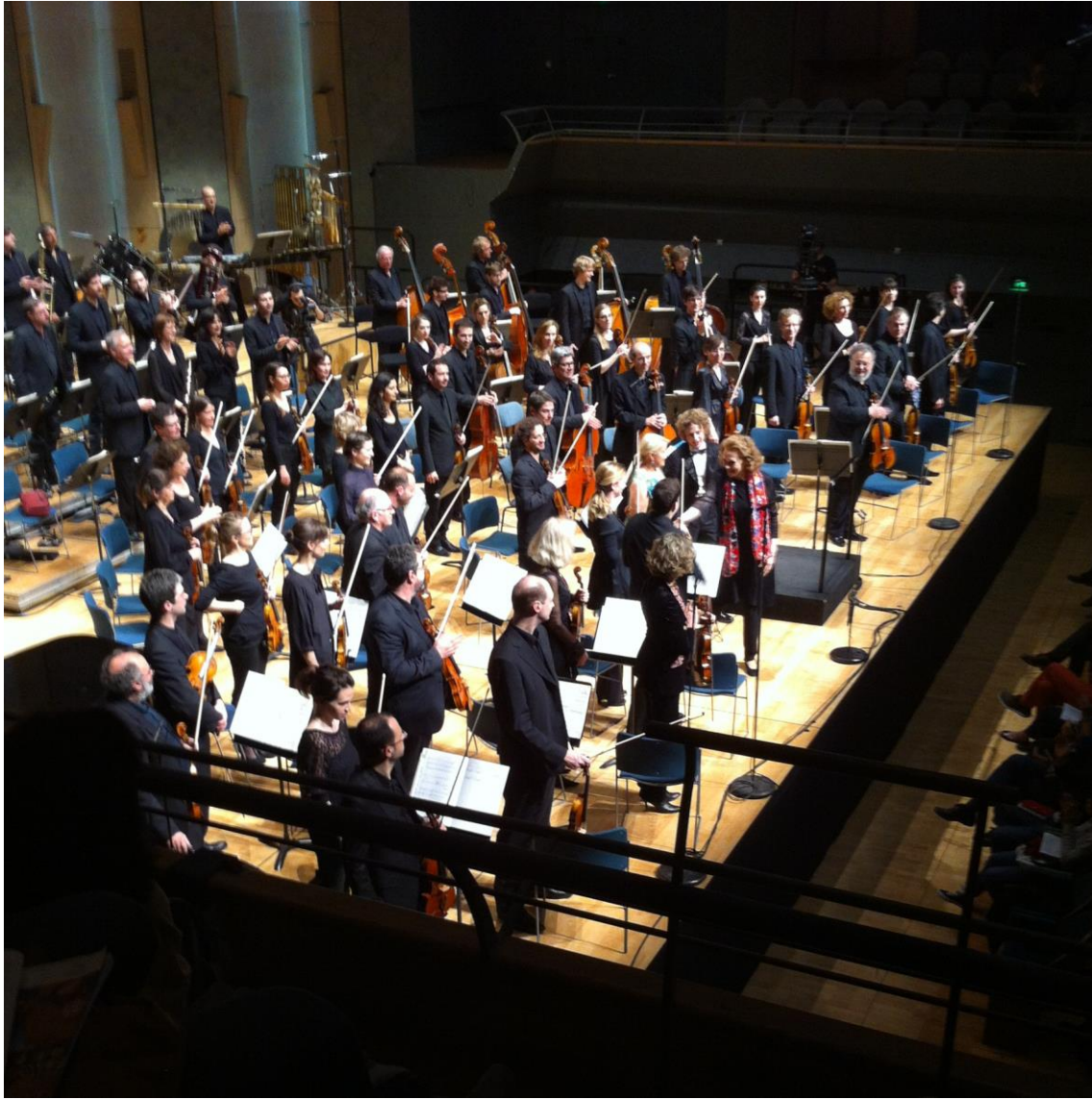
Kaija Saariaho à la Cité de la Musique.