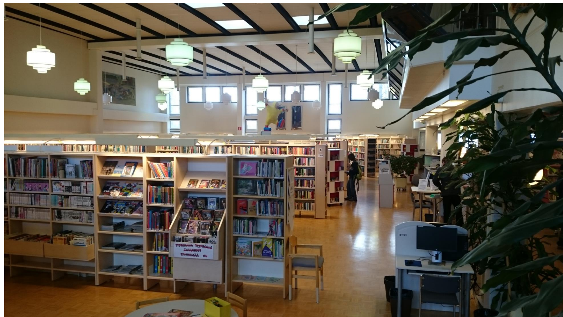
Sastamala central library